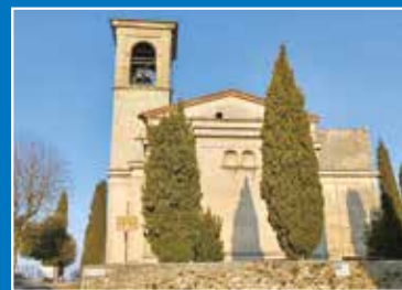
Santuario Madonna della Stella Cellatica - Concesio - Gussago

Orario esibizioni: dalle 18.30 alle 19.30 - ingresso libero Tutti i concerti si terranno in Chiesa